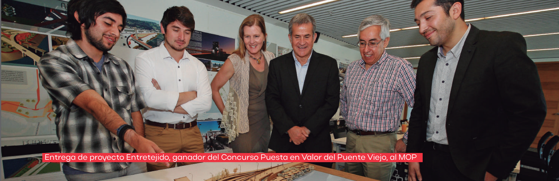
Entrega de proyecto Entretejido, ganador del Concurso Puesta en Valor del Puente Viejo, al MOP