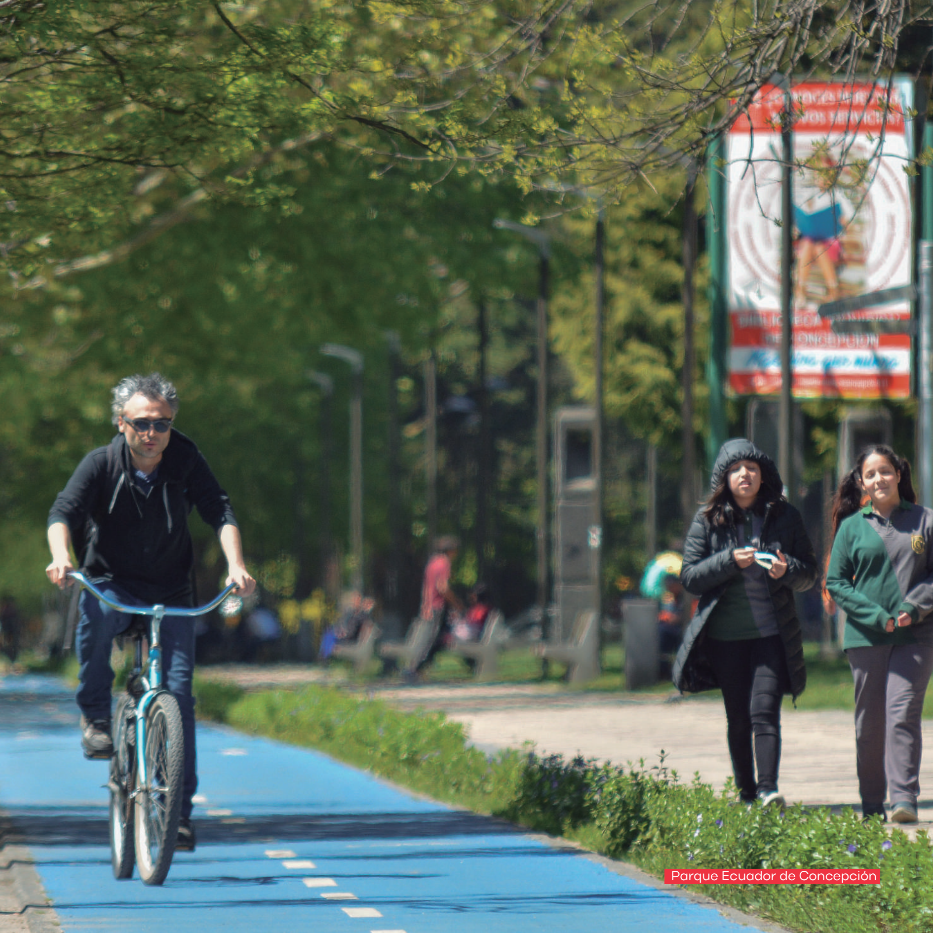
Parque Ecuador de Concepción