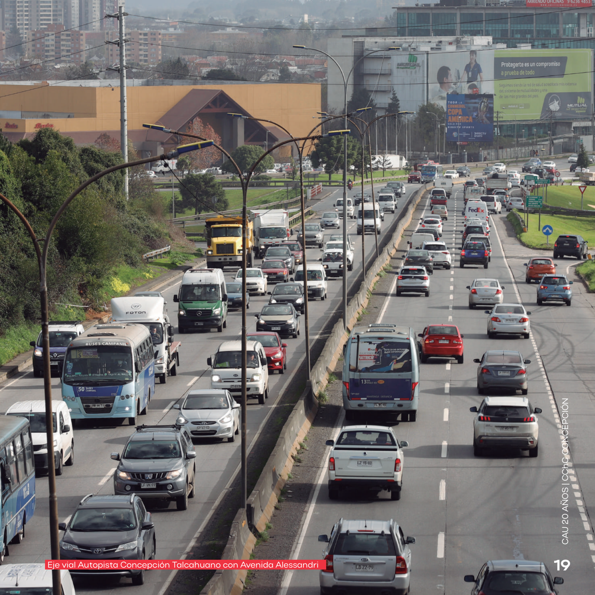
Eje vial Autopista Concepción Talcahuano con Avenida Alessandri