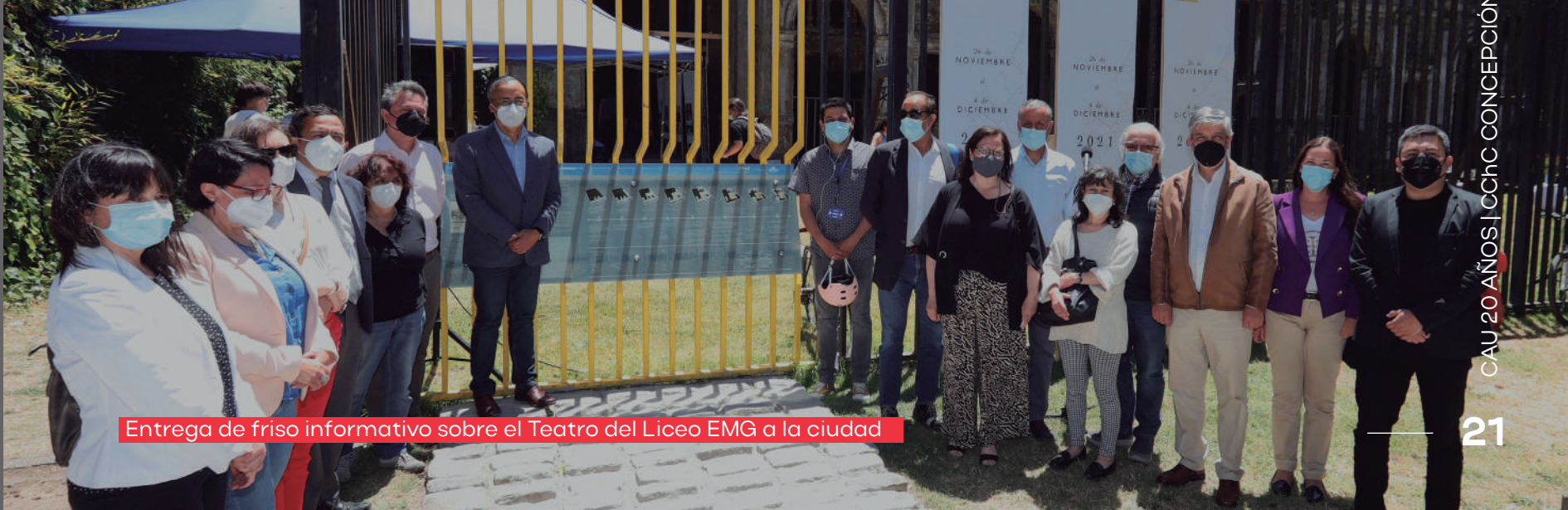
Entrega de friso informativo sobre el Teatro del Liceo EMG a la ciudad