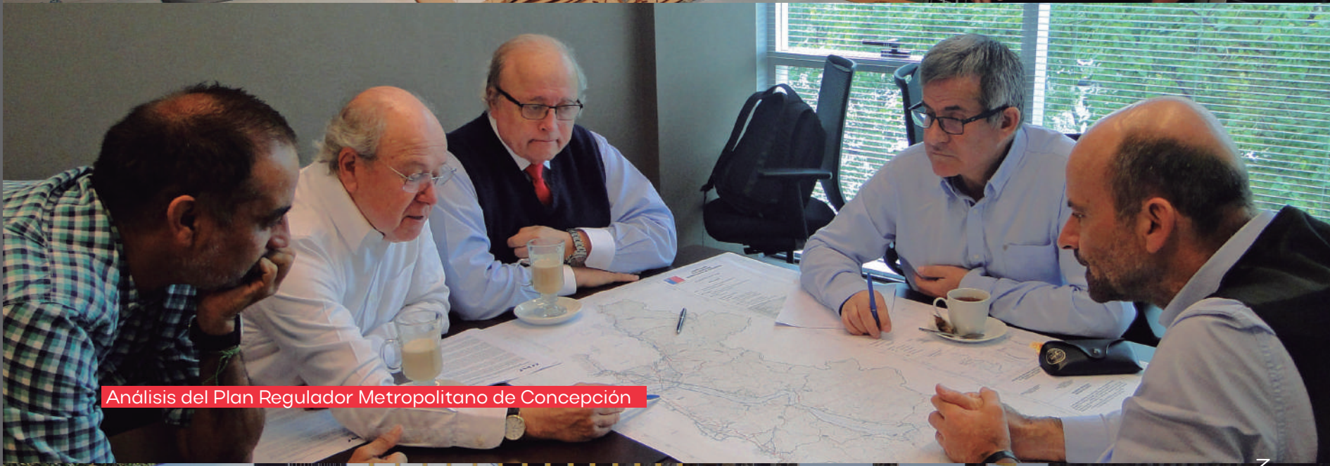
Análisis del Plan Regulador Metropolitano de Concepción